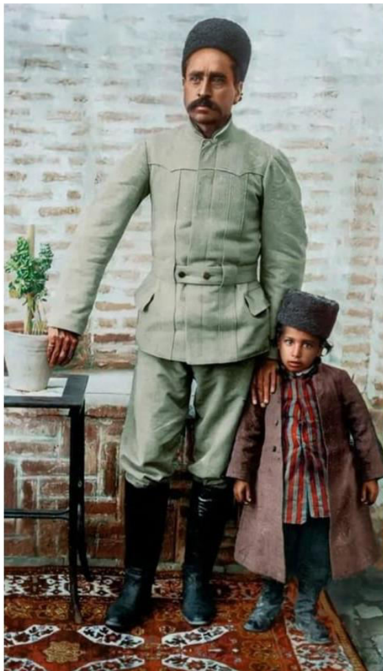
Fotoda Səttarxan və oğlu Yadulla 1907-ci il.