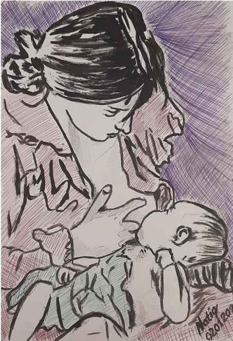
Ana (rəsm). Rəssam: Natiq NƏCƏFZADƏ